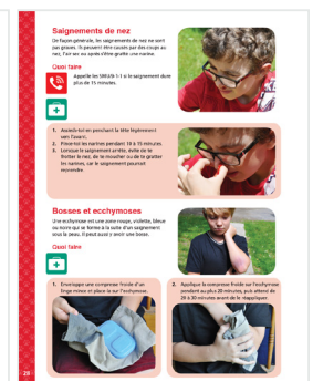
Exemples de pages