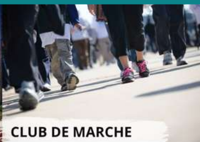
CLUB DE MARCHÉ

Une initiative pour bouger en toute liberté à même la Municipalité